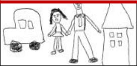
서우의 그림 설명: